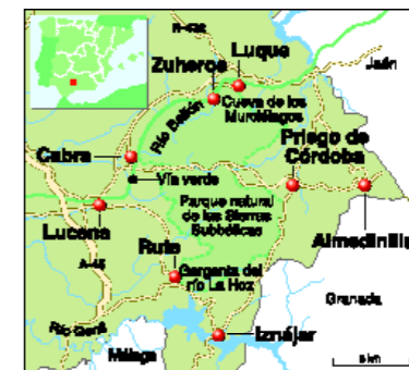
MAPA: JAVIER BELLOSO.

Además de aceite con denominación de origen Priego de Córdoba, anises, mantecados y polvorones (en temporada), hay que comprar un velón típico de bronce en la tienda especializada Gradit ( www.orfebresgradit.com ), en Lucena.