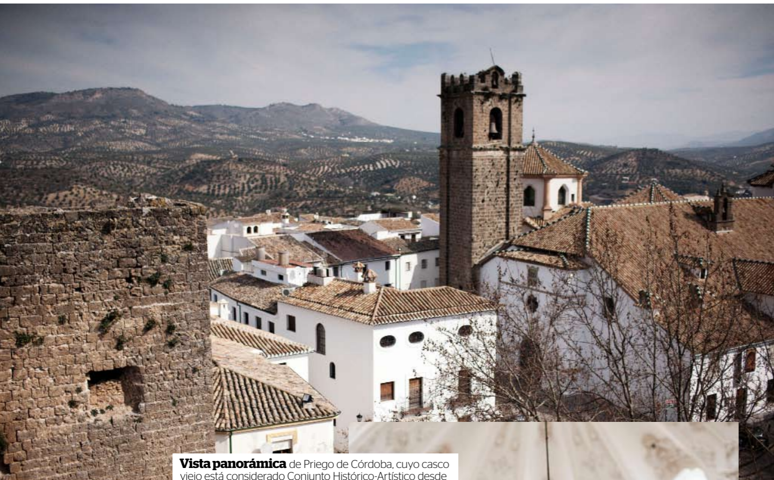
Vista panorámica de Priego de Córdoba, cuyo casco viejo está considerado Conjunto Histórico-Artístico desde 1972. Derecha, interior de la iglesia de la Asunción.